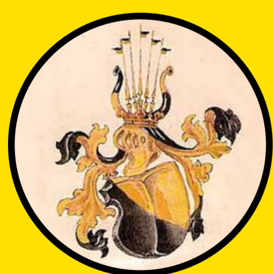
erb rodu Stillfriedů-Rattonitzů

[*1917 Ratenice - †1989 Praha] Evangelický kazatel a teolog. Od roku 1940 působil jako vikář a později farář v evangelických sborech v Jilemnici, Brně a v Olomouci. Od roku 1962 patřil ve funkci náměstka synodního seniora k druhému nejvyššímu představiteli Církve československé evangelické.