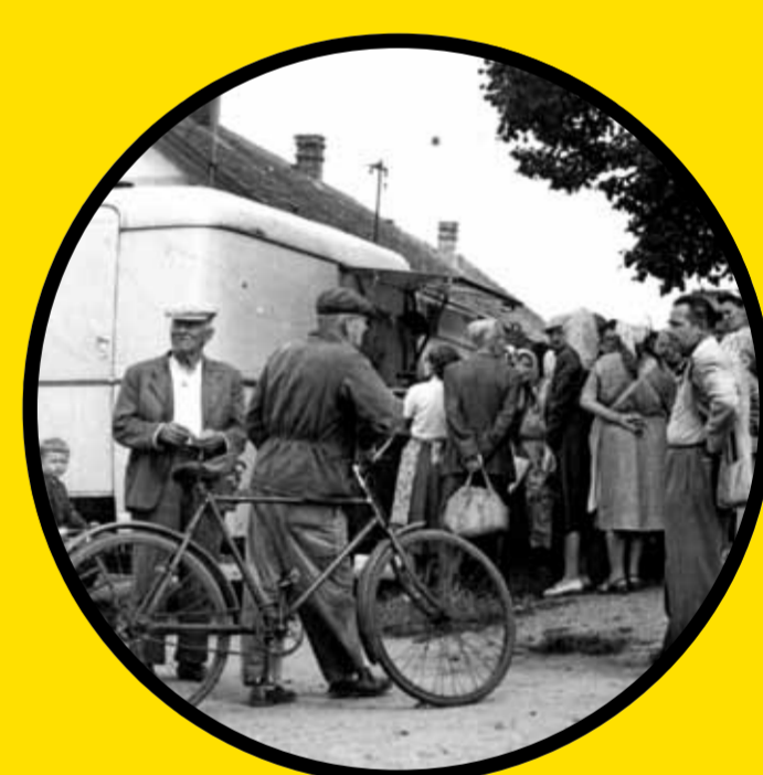
pojízdná prodejna (60. léta)