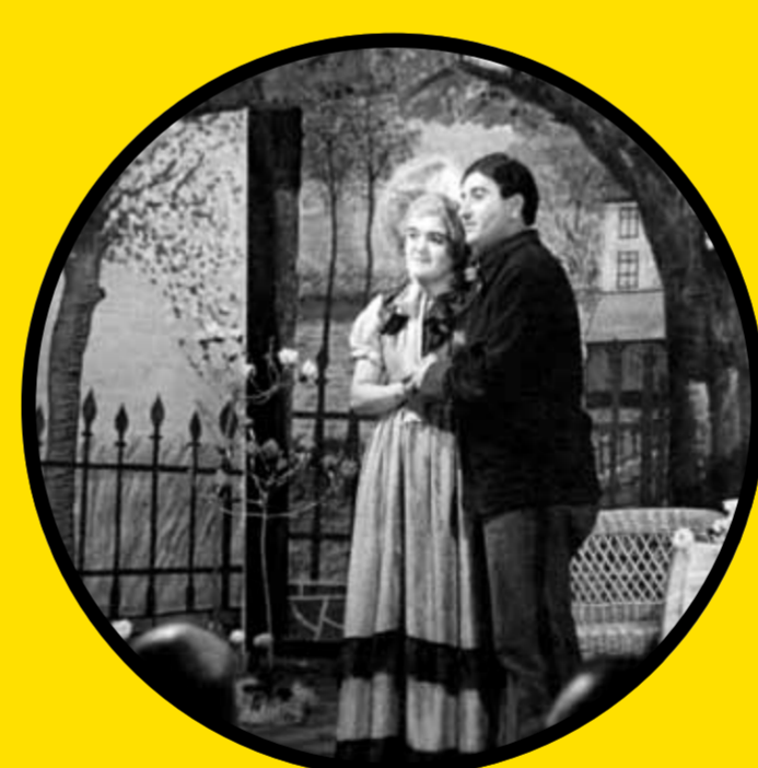
ochotnický spolek Osvěta