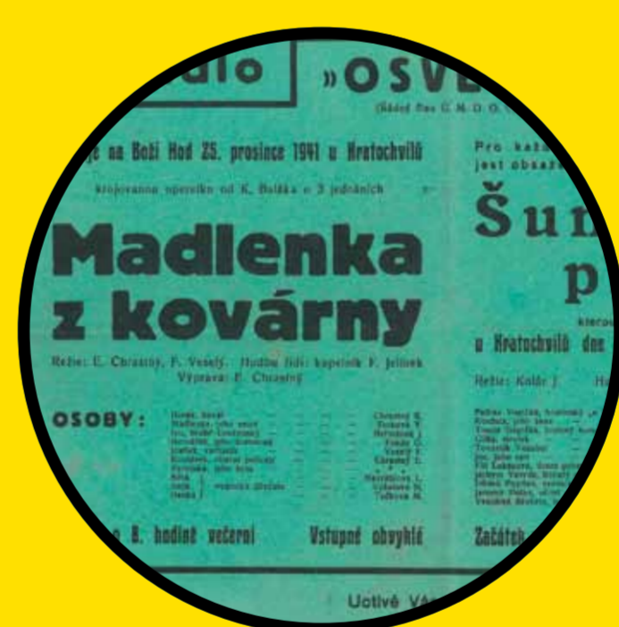
pozvánka na představení v hostinci U Kratochvilů