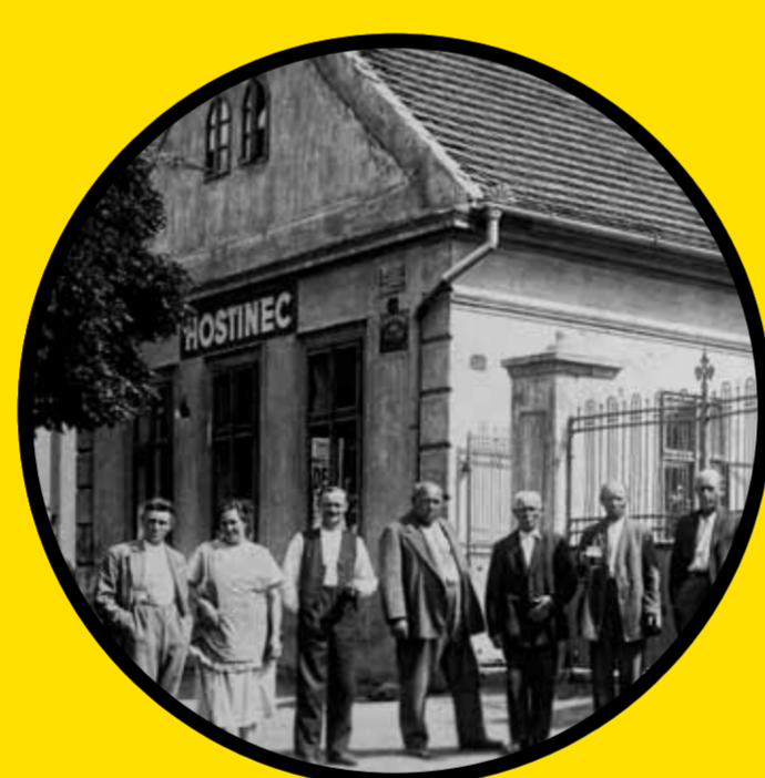
hostinec U Mariánky